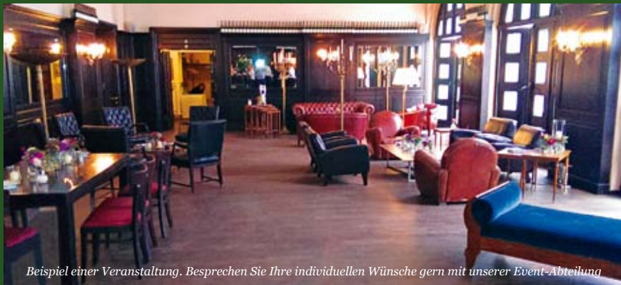
Beispiel einer Veranstaltung. Besprechen Sie Ihre individuellen Wünsche gern mit unserer Event-Abteilung